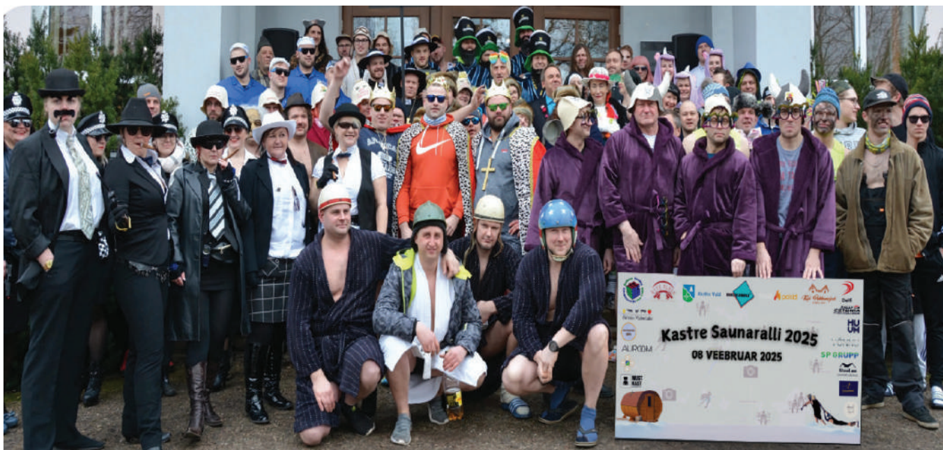
Nii see kõik ükskord alguse sai

Vaata rohkem infot facebookist: Kastre Saunaralli