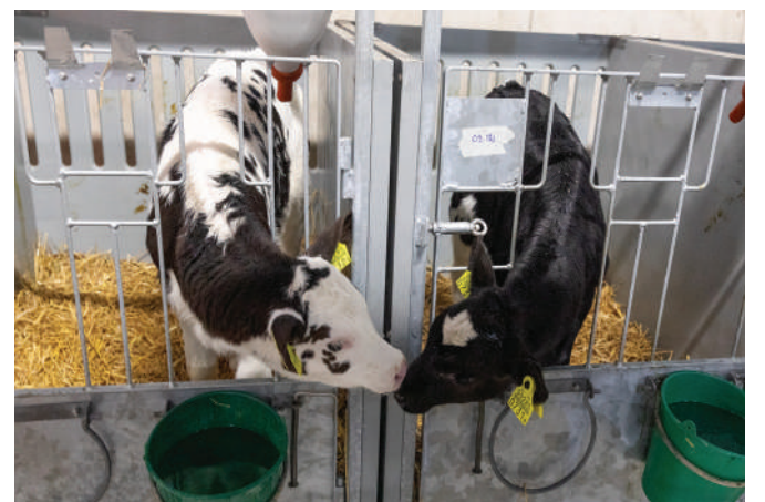
Lehmabeebid juttu ajamas