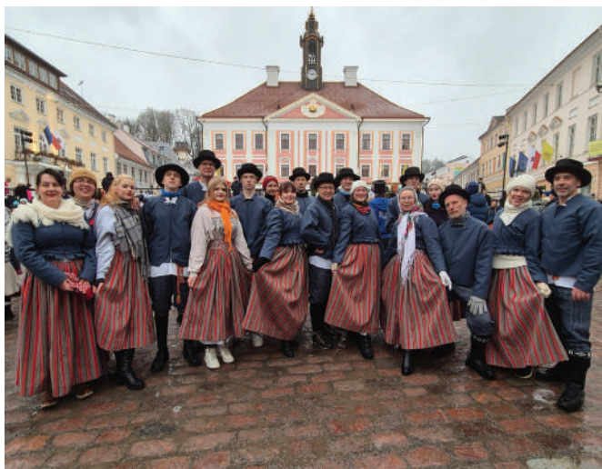
Segarühm Kaaruskraap