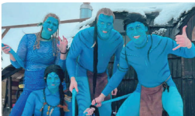
Avatarid Saunarallil