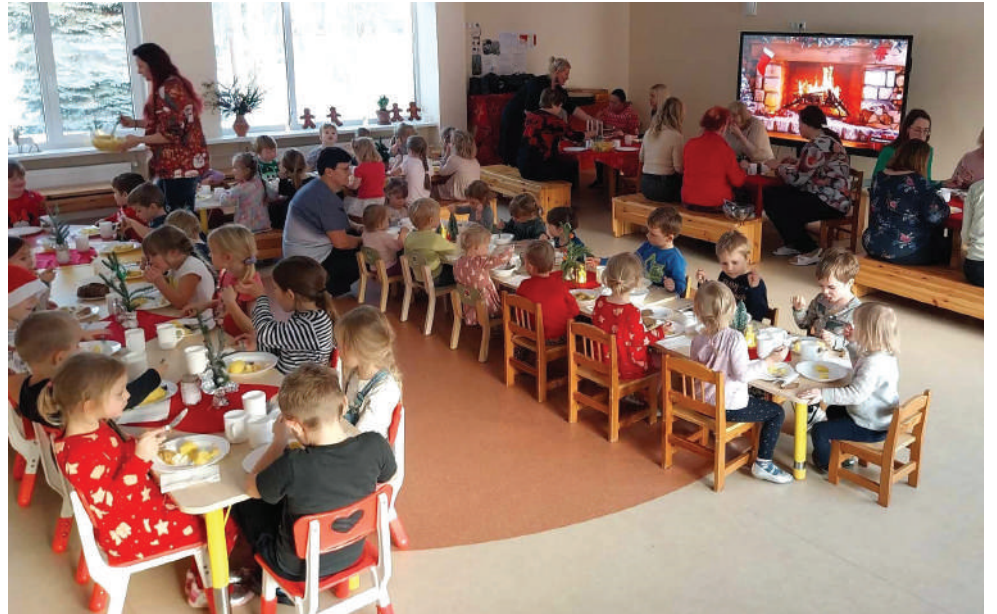
Jõululõuna lasteaias

Ja kes veel talverõõme nautida tahtis, siis mäel sai muusika saa- tel liugu lasta, kiigud ja karussellid olid samuti rõõmsad, kui lapsed