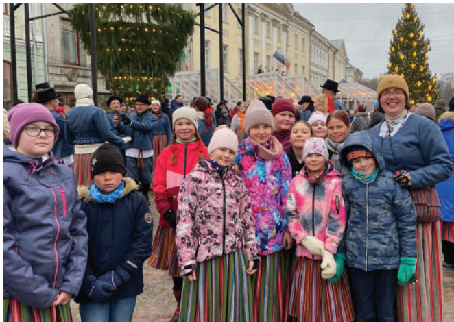
Võnnu Keskkooli tantsulapsed

Tänuühenduseks said tantsijad Tartu Rakendusliku Kolledži kõõgis valmistatud piparkooke.