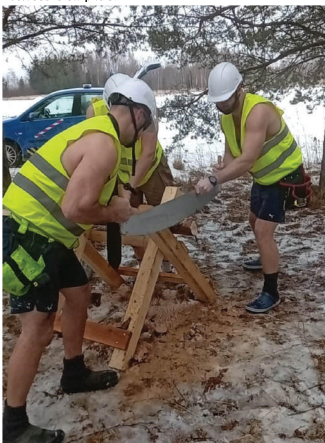
Käib töö ja vile koos

Rohkem leili, rohkem lusti, rohkem elamusi! Viska viht üle öla, kogu kokku parim saunameeskond ja tule leilirikkaimale sündmusele – Kastre VIII Saunarallile!