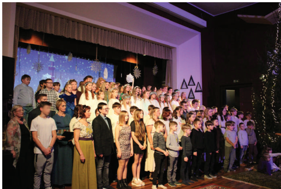
Kogu koolipere lõpulaul

Suur aitäh kõikidele, kes tegid selle etenduse võimalikuks, ning aitäh meie publikule, kelle siirast rõõmu tundis terve Võnnu kultuurimaja!