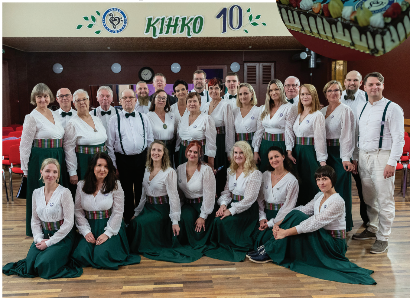
Võnnu kihelkonnakoor Kihko