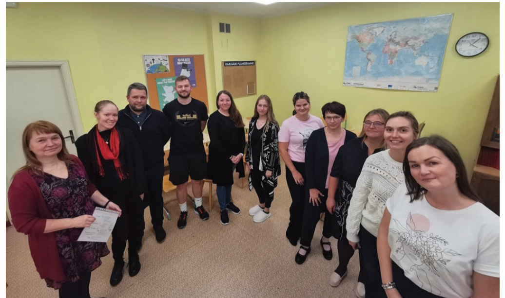
Hooliva Kooli konsultandid ja Võnnu Keskkooli rakendustiim

Soovime väga, et Hooliv Kool oleks rohkem kui projekt omades pikaajalist mõju, seetõttu lihvime oma oskusi üle kahe aasta. Esimesed kohtumised ja stardiseminargi on juba toimunud, õpetajad alustavad baasväljaõppega jaanuari alguses. Mudeli rakendamise varasem kogemus näitab, et selle tagajärjel tõuseb õpimotivatsioon ja paranevad akadeemilised tulemused. Meie Võnnus oleme igal juhul põnevil, et saame üheskoos veelgi hoolivama kooli luua.