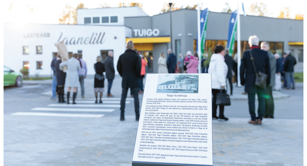
Üleval: Laanelille lasteaia Tuigo hoone on ehitatud endise Tuigo Kooli aladele Vasakul üleval: lasteaia õueala Vasakul all: köögis on loodus võimalused lastel ise kokata. All: ühe rühma mänguala