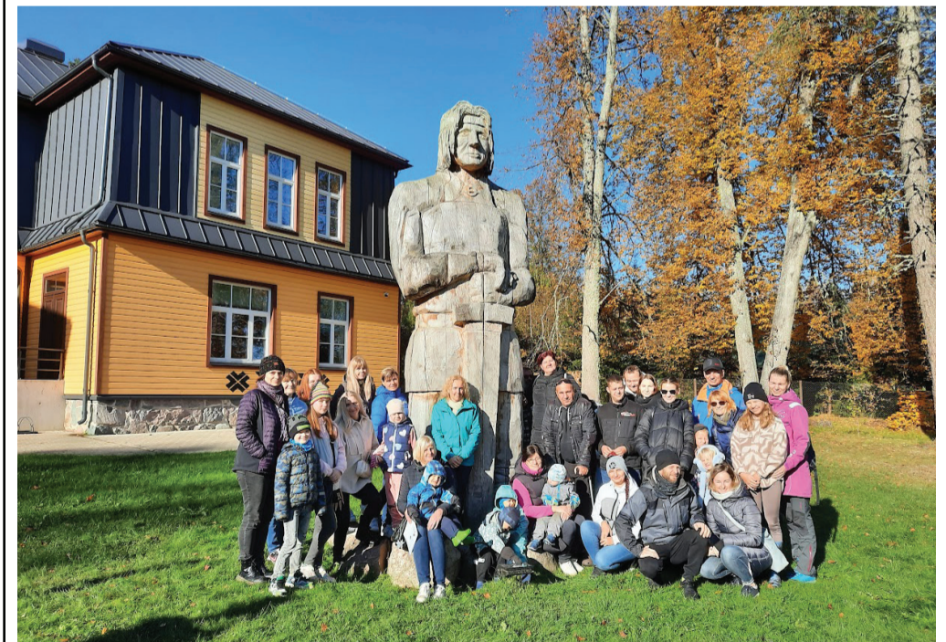
Kalevipoja juures

Võõrste Perekubi „Noorus” muutis pühapäeva, 13.oktoobri eriliseks, tähistades oma sünnipäeva Kalevipoja muuseumis. Ilus sügisilm soosis väljasõitu ning päev möödus giidi saatel muuseumis ja pargis Kalevipoja jälgi ajades. Matkarajal ülesandelehe täitmine, muuseumis Kalevipojast kokkuvõtliku filmi vaatamine, mängud ja näitused aitasid suurtel meelde tuletada Kalevipoja lugusid ning väikestel uudistajatel huvi tekitada tema vastu.