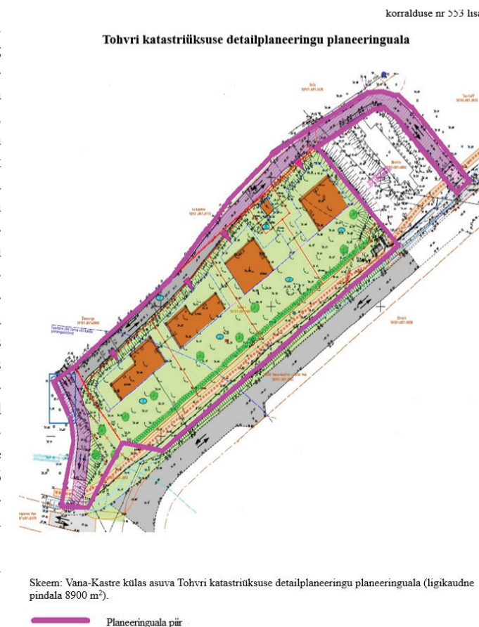
Skeem: Vana-Kastre külas asuva Tohvri katastriüksuse detailplaneeringu planeeringuala (ligikaudne pindala 8900 m 2 ).

Täiendav info: Kati Kala, kati.kala@kastre.ee, 7446521.