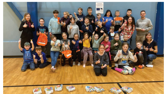
Projekti Nutikas Digipöörde sõpruskohtumine Melliste Koolis