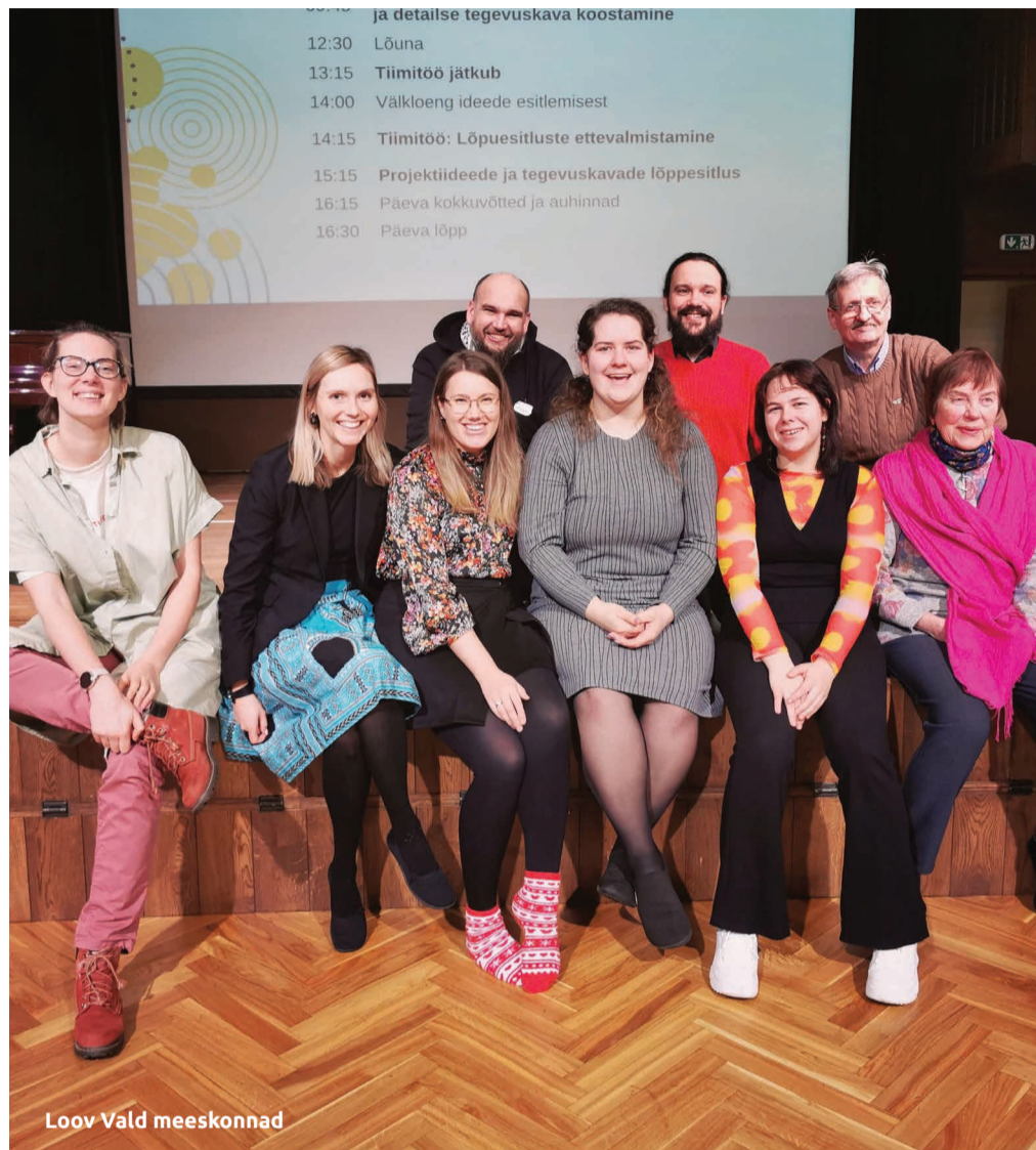
Loov Vald meeskonnad