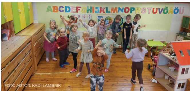
Mürakarud panid papist vurrid kiiresti pöörlema

Mürakarud tutvusid hommikuringis vastlapäeva kommetega ning lähemalt laialt tuntud seakondist vastlavurriga. Lapsed panid vurri nii kiiresti pöörlema, et seda oli kuulda kui kassi tasast nurrumist. Seajala kondist vastlavurri oli rühmas üks ning iga laps meisterdas endale tänapäevase papist vurri, millega omavahel jõudu katsuti - kelle vurr kõige kiiremini ja kauem pöörleb. Nagu vanarahvale kombeks suundusid ka mürakarud õue möllama, et sõita pikki liuge staadioni nõlvast alla. Enne tupp