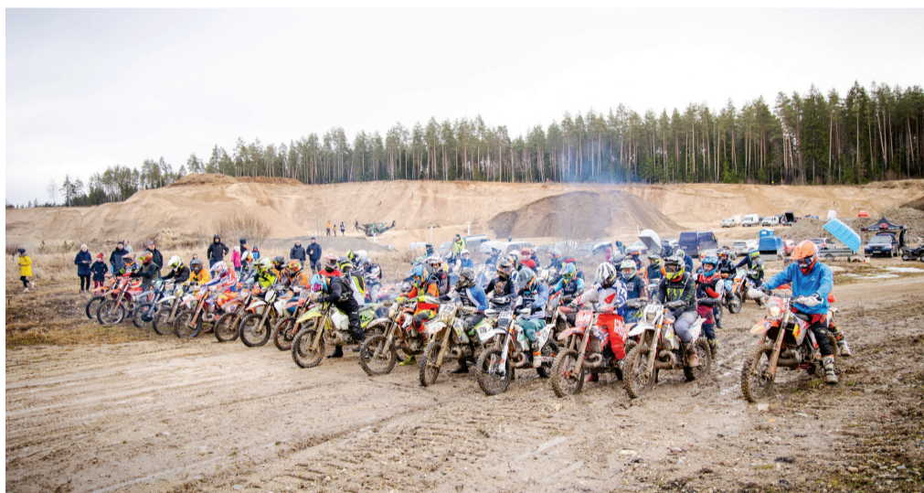
Soolode stardirivi Siimusti karjääris toimunud Apex Enduro Cupi hooaja avataapil.

Tegemist on Apex Enduro Cupi sarja teise hooajaga, mida korraldab Tigase külas tegutsev MTÜ Tigase Rallirada. Apex Enduro Cupi esimene hooaeg toimus mullu sügisel Kastre vallas kolmeetapilise võistlusena. Kui varem on MTÜ Tigase Rallirada võistlusi korraldanud autodele, kus lubatud osaleda ka mootorratturitel ja lasteklassidel, siis eelmisel aastal löime täiesti uue sarja, mõeldes just algajatele motohuvilistele ja lastele. Sel hooajal on MTÜ-l Tigase Rallirada plaanis korraldada Apex Enduro Cupil kuus etappi – kolm etappi kevadel ja kolm sügisel. Järgmine etapp toimub juba 13. aprillil Mäksa kolhoosi rajal. Kastre vallas sõidetakse veel sarja „Apex