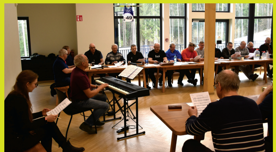
Haaslava meeskoor Festivaliks Kaera-Jaan harjutamas.

Rahvusvaheline koostöö on üheks Euroopa kultuuripealinna Tartu 2024 kohustuslikuks elemendiks ning Initiumi kompanii kunstnikud on aprilli esimeses pooles veel eelviimast korda vallas proove tegemas. Suur logistiline vägitükk saab viimase lihvi mai teises pooles toimival prooviperioodil, millega peaks etendus lõplikult purki saama. Viimases etapis liigutakse proovidega juba etenduspaika, Vooremäe terviseradadele.