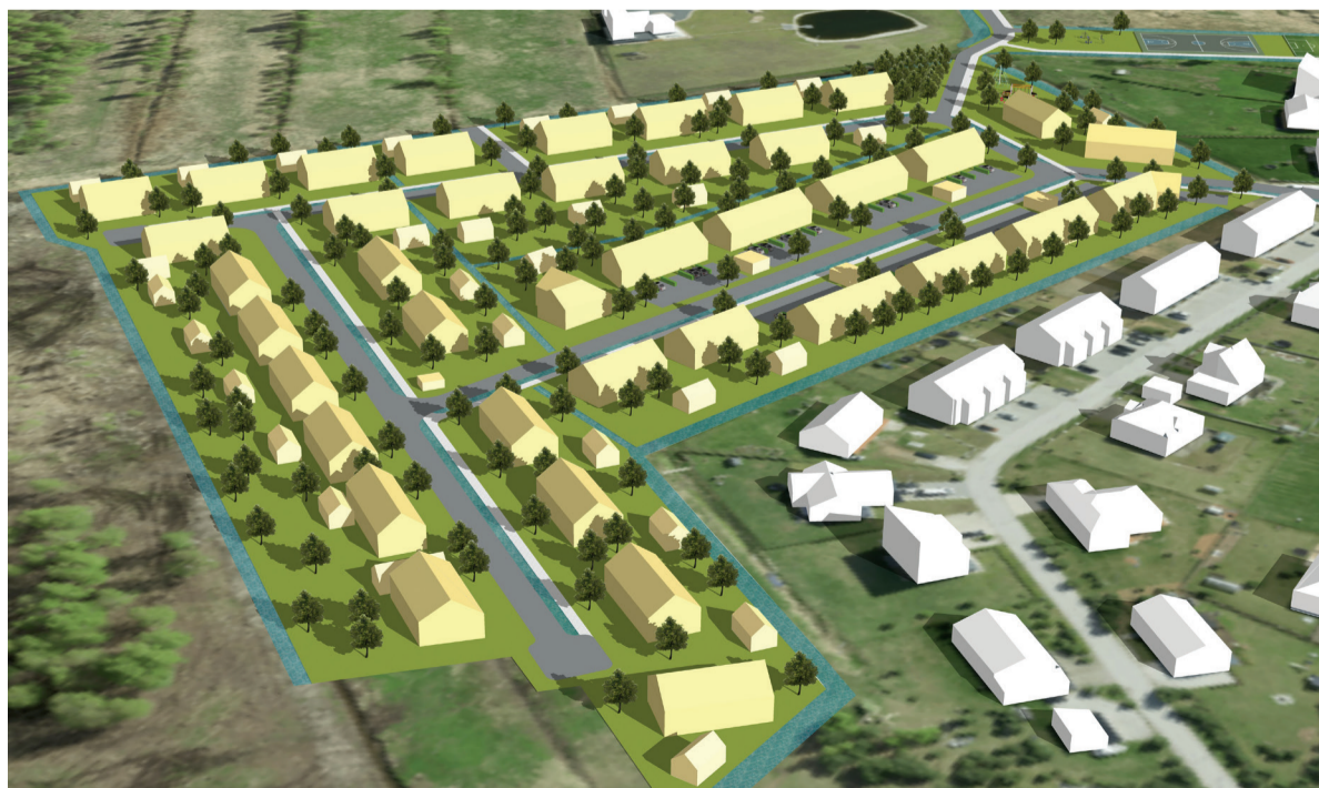
Savitööstuse ning selle lähiala katastriüksuste detailplaneeringu ruumiline illustatsioon.

Tuletage meelde, et igasugune kulupõletamine on ohtlik ja kõikjal Eestis keelatud!