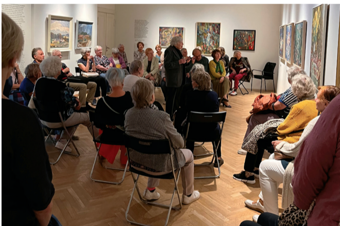
Seenioride reede Tartu kunstimuseumis.

Järgmised ekskursioonid Tartu linnas asuvas Tartu kunstimuseumi viituses majas (Raekoja plats 18) toimuvad 26. aprillil, 31. mail, 28. juunil ja 27. septembril. Selle aasta viimane „Seenioride reede“ toimub 29. novembril.