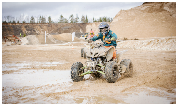
Rajal oli nii suuri kui väikeseid võistlejaid.

Enduro Cup“ viiendat etappi 29. septembril Mäksa kolhoosi rajal ja kuendat etappi 6. oktoobril Tigase rallirajal.