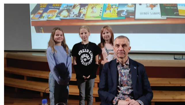
Õpilased tegid tutvust Ilmar Tomuski loominguga.

Võnnu raamatukokku jõudis pärast kohtumist rohkem õpilasi, kes soovisid laenutada just Ilmar Tomuski raamatuid.