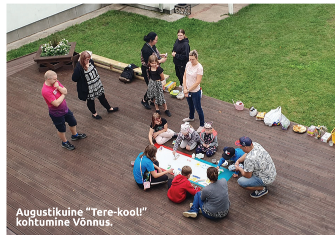
Augustikuine "Tere-kooli" kohtumine Vönnus.

Sügis-talvisele perioodile jäi ka mitmepäevane HOP programmi koolitus, kus osalesid Kastre valla haridusasutuste