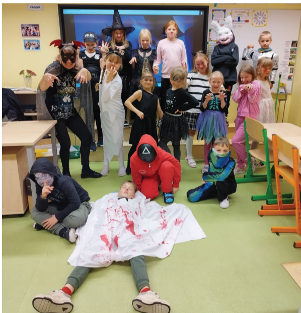
2. klassi halloween.

lahedad välja. Toimus disko ja igal klassil toimusid ka klassiõhtud. Klassiõhtul saime mängida näiteks "Pikka nina". Mängisime terve kooli peal peitust, nii vahva oli. Toimus ka tagaotsitavate mäng, kus tagaotsitavad olid õpetajad. Kui keegi leidis õpetaja, tuli ta viia selgeltnäigja (loovjuhi) juurde, kes andis tagaotsitava eest autasu. See oli täiega põnev ja naljakas. Päeva lõpetas disko saalis. Disko oli nii lahe. Lõppude lõpuks oli päev väga-väga tore ja huvitav, seda tuleb kindlasti korrata!