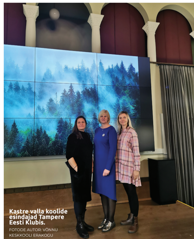
Kastre valla koolide esindajad Tampere Eesti Klubis.

Aastatel 2022–2024 osaleb Kastre vald koos kõigi Tartumaa omavalitsustega Tartumaa heaoluprogrammi (HOP) rakendusmudeli loomise ja piloteerimise projektis. Selle eesmärk on laste ja perede heaolu suurendamine ning elukvaliteedi parandamine, keskendudes laste hariduslike erivajaduste ja toevajaduse varajase märkamise ning laste toetamise tõhustamisele. Projekt on rahastatud Euroopa Majanduspiirkonna ning Norra finantsmehhanismi 2014–2021 toel läbi Riigi Tugiteenuste Keskuse.