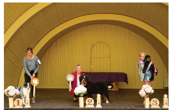
Koertesõu autasustamine Kurepalu laululaval.

AUTOR: AUTOR: FANTAGIRO HANKO, KUREPALU MATCH SHOW KORRALDAJA