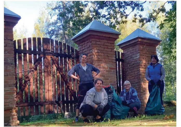
Haridus- ja kultuuriosakond koristas Võnnu kalmistutel.