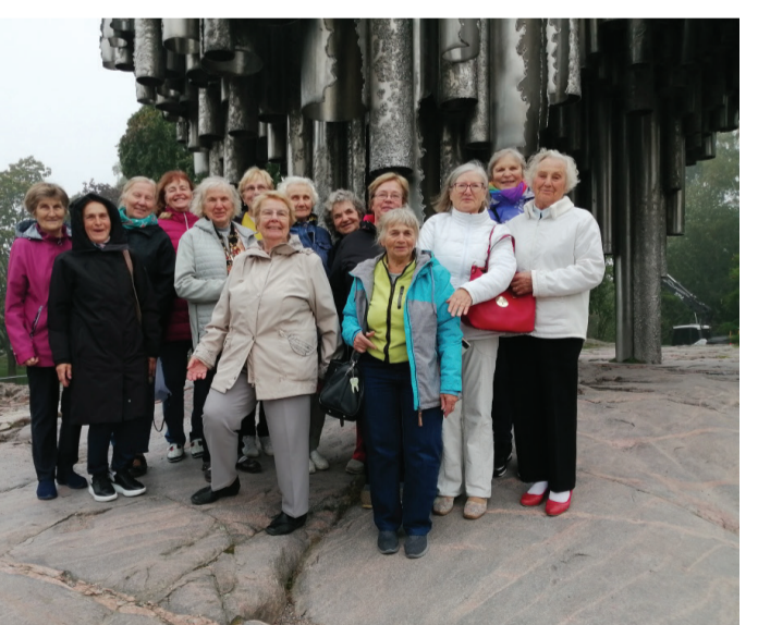
Koondrühm Soomes Sibliuse monumendi juures.

Edasi viis meid tee Helsingi Talveaeda, kus kasvuhooes kasvavad paljud eksootilised taimed vastavalt aastaajale. Väljas nautisime roosiõite ilu. Küllastasime ka Soome kõige populaarsemat arhitektuurilist vaatamisväärsust – Helsingi Töölo linnaosas asuva Templi väljaku kaljukirikut, kus