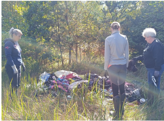
Ametnikud koristasid metsa alla toodud jäätmeid.