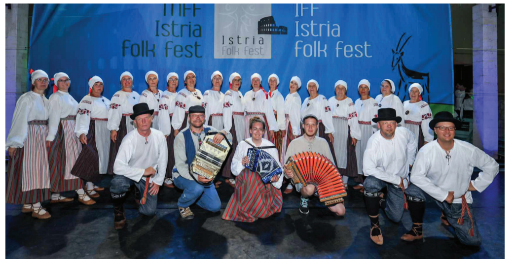
Kastre valla rahvatantsurühmad ja pillimehed Horvaatias rahvusvahelisel folkloorifestivalil "Istria Folk Fest 2023"

Festival toimus kahel päeval ja kahes erinevas linnas. Esimesel päeval toimus festival Novigradis