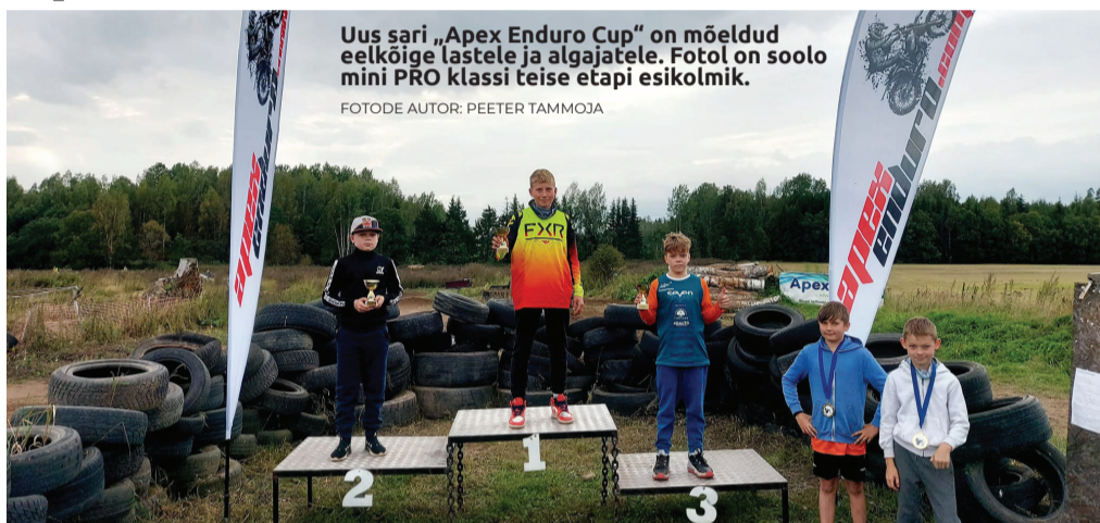
Uus sari „Apex Enduro Cup“ on mõeldud eelkõige lastele ja algajatele. Fotol on soolo mini PRO klassi teise etapi esikolmik.

Kolmel etapil osales 121 võistlejat, kellest 28 olid lap-