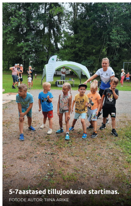
5-7aastased tillujooksule startimas.

Malevat korraldasid valla noortekeskused ning rühmajuhtideks olid noorsootöötajad Malen, Maili, Kerli ja Triin. Täname kõiki abikäsi!