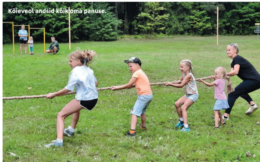
Kõievol andsid kõik oma panuse.