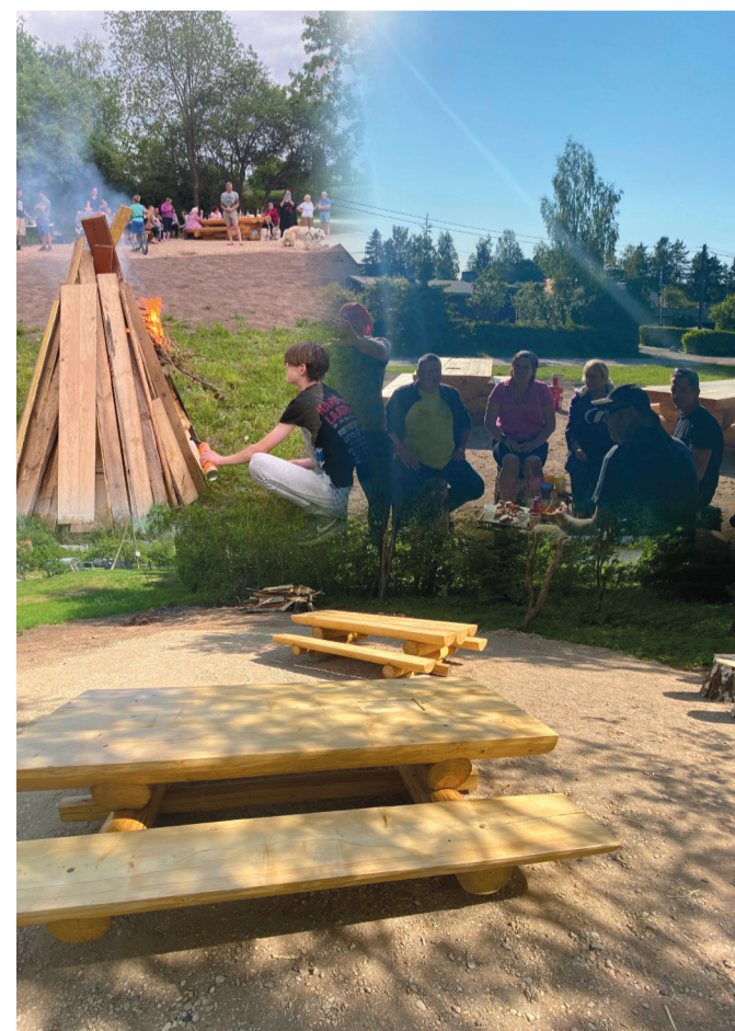
Tarekese rahvas alustas kevadel külaplatsi kujundamisega, mis sai jaanipäevaks valmis.

Edaspidi, kui on taas tulemas ühiskoosolekud, peod või mõni vahva külapäev, ei pea muretsema istumiskoha leidmise pärast ning tantsuplats on ka kõigile soovijatele avatud. Suur tänu MTÜ Tarekese juhatajale!