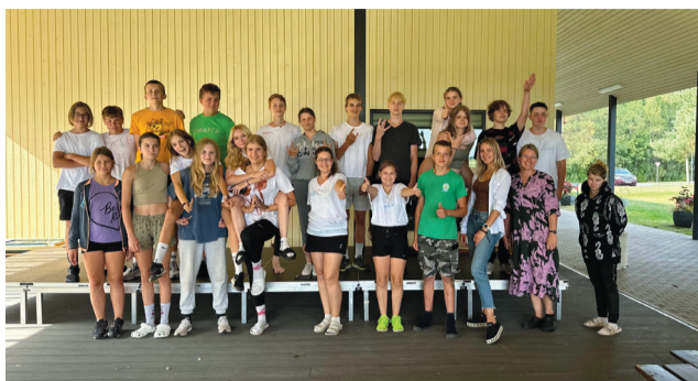
Kastre valla noorte töömalevas osalenud noored koos juhendajatega.