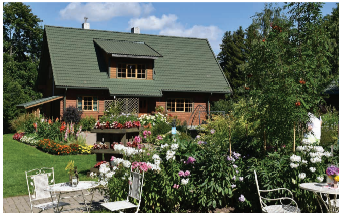
Lisandväärtusena pakkus Jõgari Aia Kohvik ka aiatuure pereinaisele.