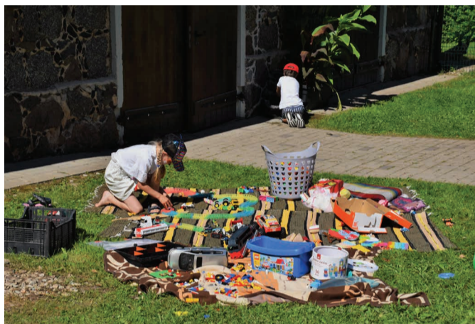
Mitmed kodukohvikud mõtlesid ka selle, kuidas pakkuda tegevust ja emotsioone pisematele külalastajatele kas mängulade või töötubade näol.