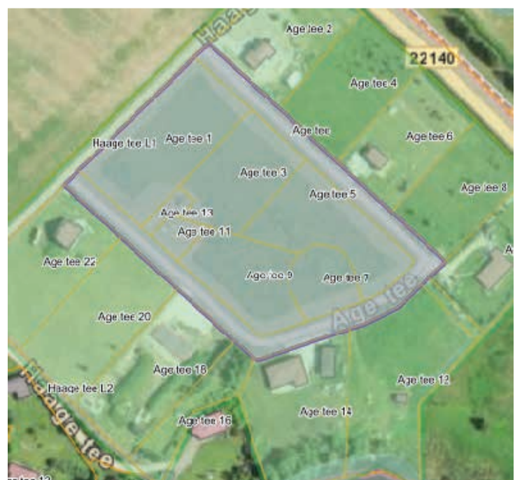
Age planeeringuala joonis