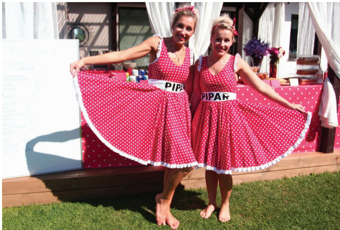
14. augustikuu päeval sai taas seigelda Maitsva Toidu Teel. Teekonnal Sillaotsalt Suurekivini võõrustas külalisi kuupäevale sarnaselt 14 kodukohvikut.