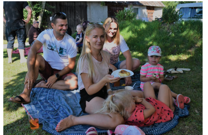
Meilise suveilm meelitas kohale külalisi nii lähemalt kui kaugemalt. Kokku tehti üle 1000 külastust.