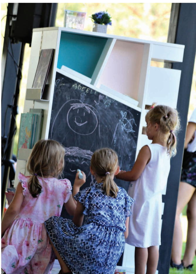
Mellistes sai ka batuudil hüpata, näomaalingut tellida, asfaldile joonistada, seebimulle teha, butafoorset kooki valmistada.