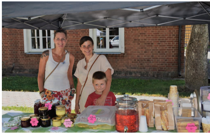
Teistest valla paigust tulnud toitlustajad ja kauplused said kokku Kurepalus Vallamaja parkimisplatsil.