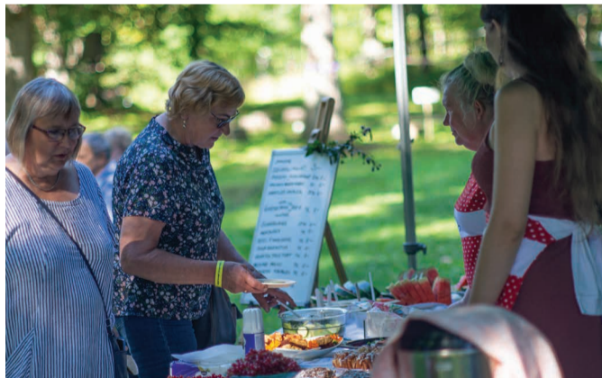
Tartumaa loometalgud võitnud Kriimani Kinomõisa projekt jõudis külapäeval võiduka esimese linastuseni seal juba 50ndatel kinolinal olnud „Tarzan the Ape Man“ uuesti näitamisega.