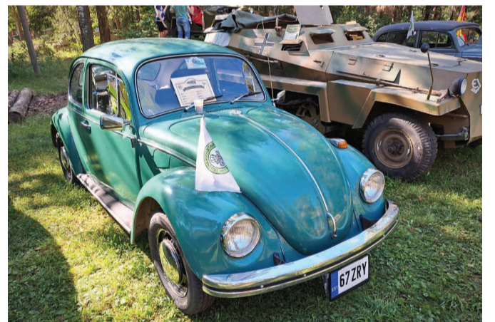
Wolksvagen põrnikas ja Teise Maailmasõjaaegse Saksa soomustransporditööri täpne koopia Vanatehnika päeval.