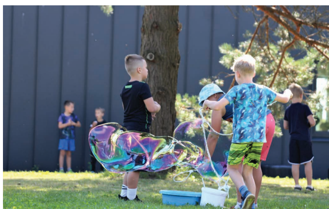
Melliste perepäevaga tähistati Melliste küla esmamainimise 440. aastapäeva. Toimused põnevad töötodad, lisaks said offroad autosid uudistada ja üheskoos kapelliga HääMiil laulu lüüa.