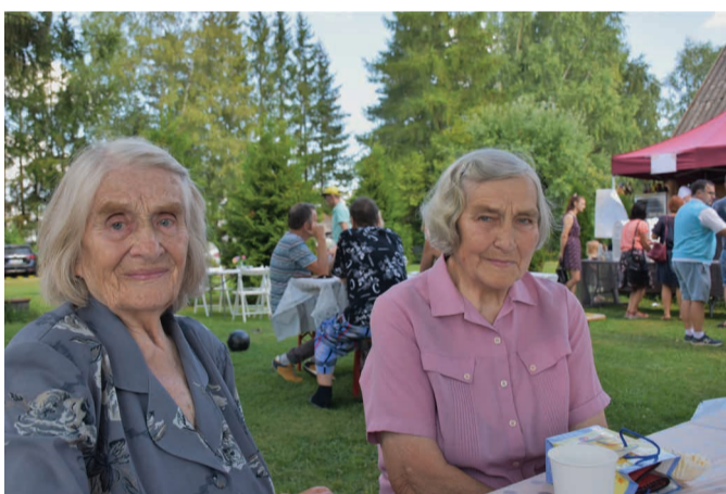
Võtta see hetk, see kook või snakk, jagada sõbra või naabriga - see ongi ilusa suvepäeva retsept.