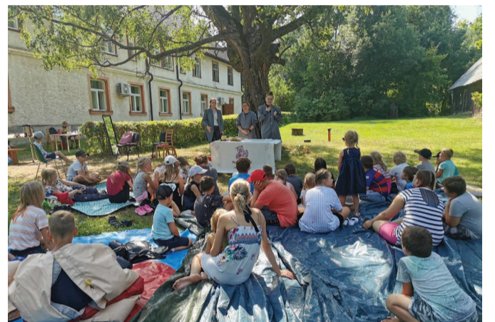
Mäksa Maanaiste Seltsi korraldatud põnevaid tegevusi täis ja täiesti nutivabal elamuspäeval Elagu suvi ja seiklused sai proovile panna enda sumomaadluse oskused, õppida näiteks patsitegu, hullata õhulossis.