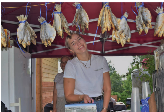
Koogigrami kohvikust käis läbi sadu külalastajaid ning sära abiliste silmadest sellest ei raugenud, vaid sai helki juurde.