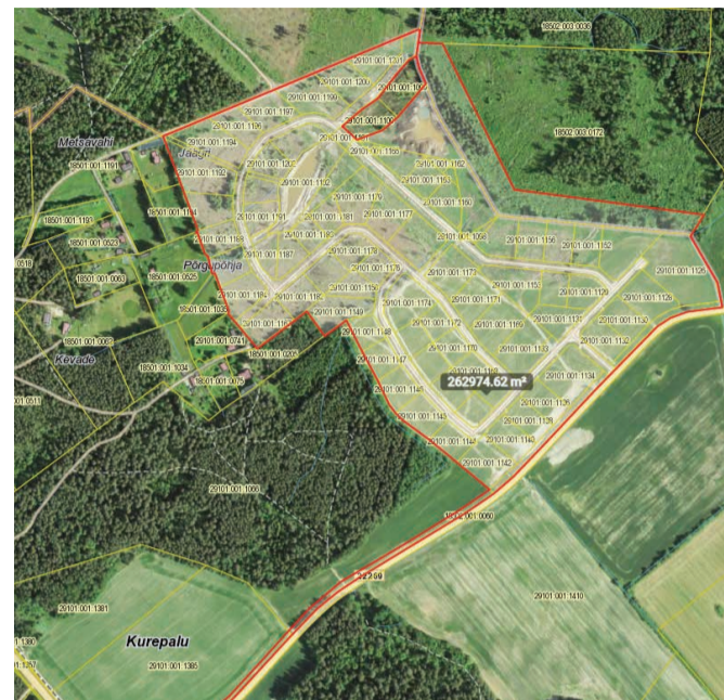
Kurepalu külas asuva Kureoja detailplaneeringu planeeringuala muutmine

kavandamise eesmärgil ning planeeringuala laiendatud osale hoonete püstitamiseks ehitusõigust ei määrata. PlanS § 130 lõike 3 kohaselt on planeeringuala muutmise lubatud planeerimisala tegevuse korraldaja ja huvitatud isiku kokkuleppel. Detailplaneeringu planeeringuala muutmiseks on planeeritava ala pindala ligikaudu 26.30 ha. Kastre Vallavalitsus on seisukohal, et antud planeeringuala piiri muudatus ei ole ulatuslik ja oluline, sest seoses piiride muutmiseks ei muutu planeeringuala eesmärk ja planeeringuala piiride muutmise ei muuda planeeringu põhilahendust. Planeeringuala muutmise informeeritakse kooskõlastajaid, koostöö tegijaid ja kaasatavaid PlanS § 133 lõike 1 märgitud etapis st siis kui detailplaneering edastatakse käesoleva seaduse §127 lõikes 1 nimetatud asutustele kooskõlastamiseks ning käesoleva seaduse