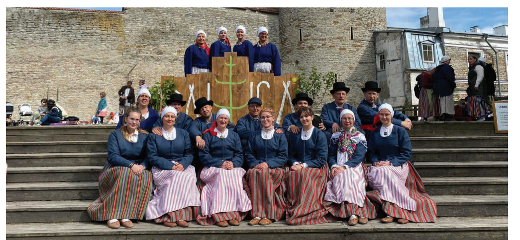
Pärimuspidu Baltica Tallinn Tornide väljakul.

Ikka jäljendades klassikuid: "Tule meie sekka, igatahes."