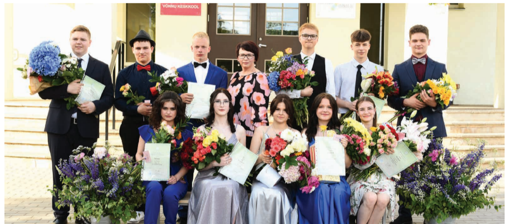
Võnnu keskkooli 9. klassi lõpetajad.