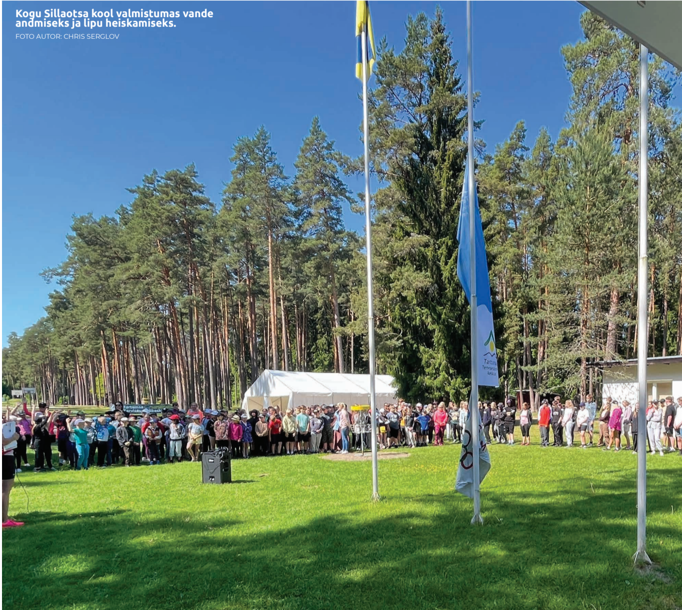
Kogu Sillaotsa kool valmistumas vande andmiseks ja lipu heiskamiseks.