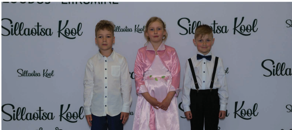
Roju lasteaia Vandersellide rühma lõpetajad.

Palju õnne lõpetajad, olge uhked oma saavutuste üle ja ärge unustage alati hoida oma õpiväärtust, avatud meelt ja sooja südant!