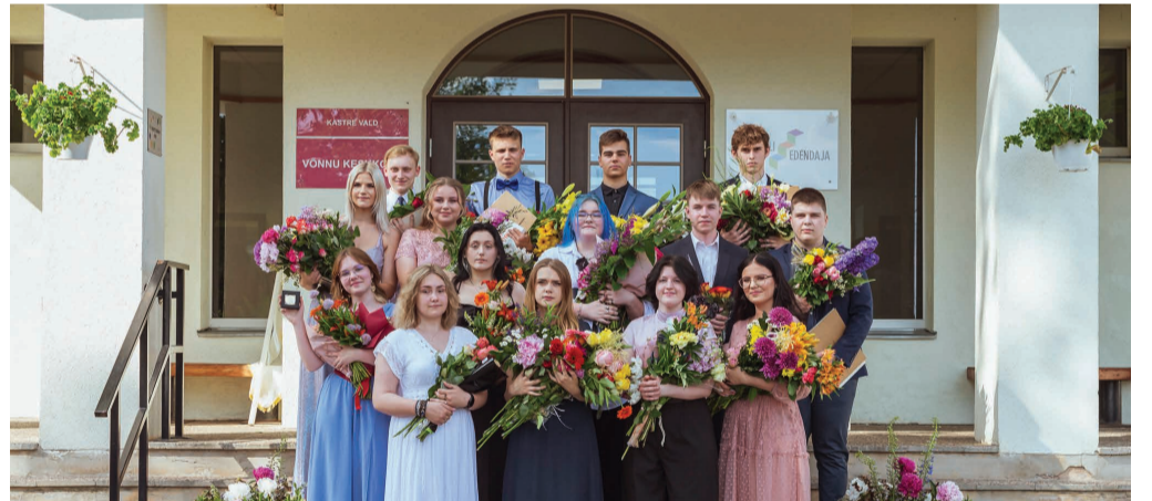
Võnnu keskkooli 12. klassi lõpetajad.