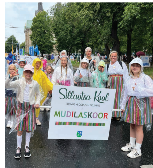
Sillaotsa kooli mudilaskoor rongkäigul.