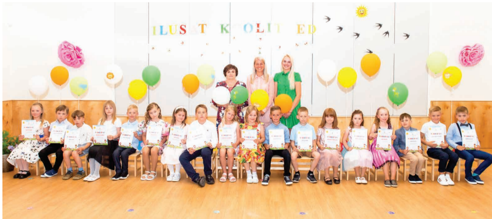
Haaslava lasteaia lõpetajad.