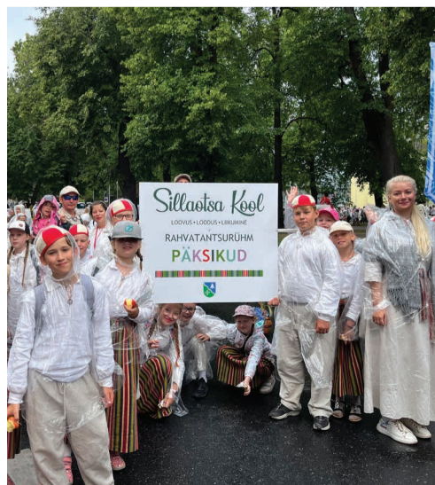
Sillaotsa kooli rahvatantsurühm Päksikud rongkäigul.

Hetkel teadaolevatel andmetel oli lauluväljakult päeva jooksul külastajaid natuke üle 51 000, laulupeol osales 778 kollektiivi üle 23 000 laulja ja muusikuga. Rahvamuusikapeol astus üles 830 pillimängijat, tantsupeol ligi 8500 tantsija ja võimleja. Laulu- ja tantsupeol kokku oli üle 31 000 esineja.