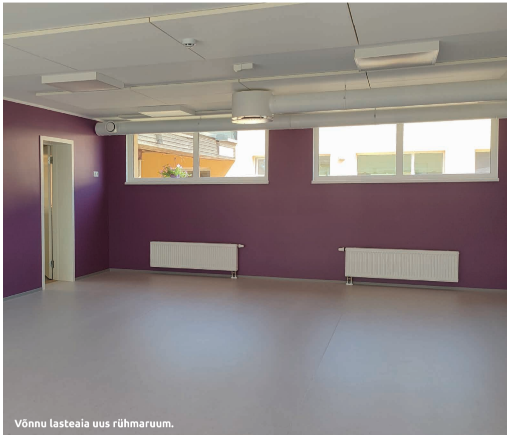
Võnnu lasteaia uus rühmaruum.

Renoveeritud rühma ruumid on saanud looduslikest toorainest keskkonnasõbraliku linoleumpõranda, mis on laste tervisele sobilik ja ohutu. Rühmaruumi siseõhu kvaliteedi tõstmiseks ehitati välja ventilatsioonilahendus, kus paigaldati kaasaegsed ventilatsiooniseadmed ja -süsteem ning