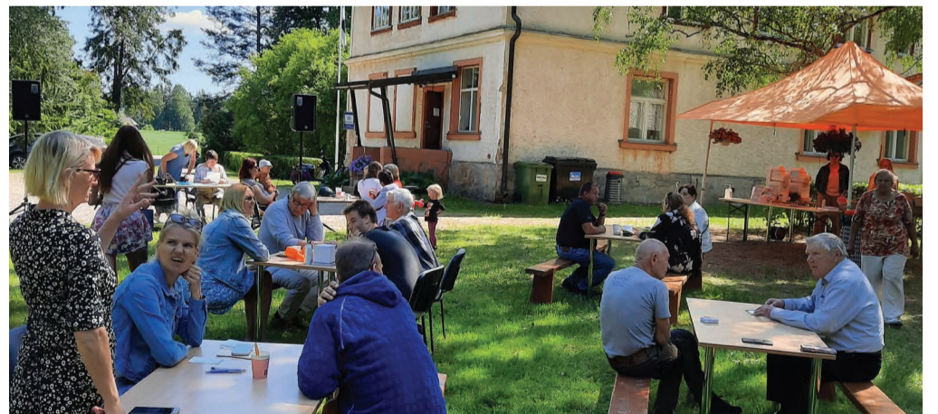
Külapäeva raames korraldati ka mälumängu, milles osales viis võistkonda.