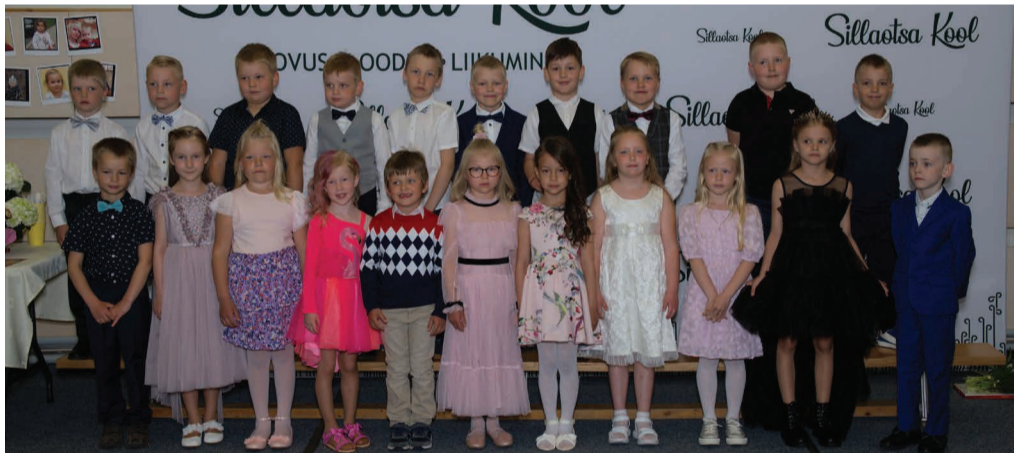
Roju lasteaia Marakrattide rühma lõpetajad.