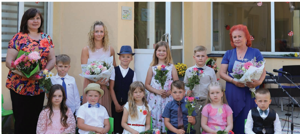
Võnnu lasteaia Värvuke lõpetajad.