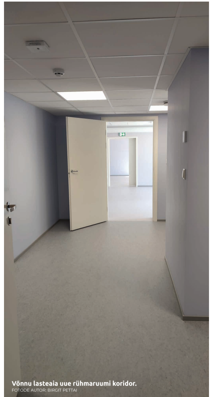
Võnnu lasteaia uue rühmaruumi koridor.

Täname tööde teostajat Uniro Grupp OÜ ja Kastre vallavalitsust lasteaia kasvukeskkonna kaasajastamise eest!