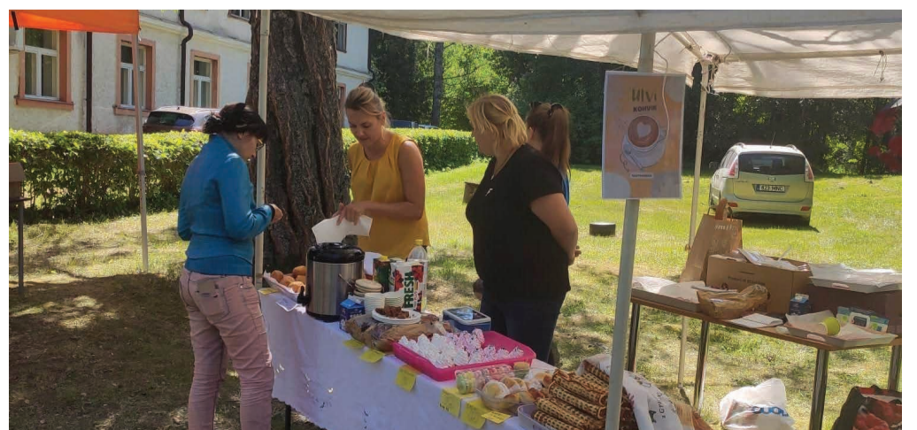
Hõrgutavaid maiustusi külapäeval pakkus Ulvi kohvik.