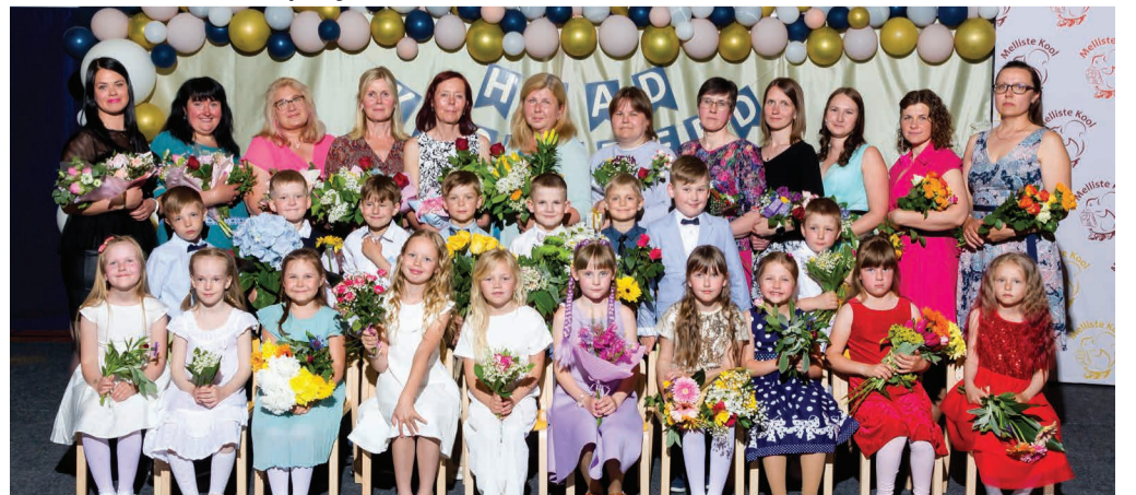
Melliste kooli lasteaia lõpetajad.