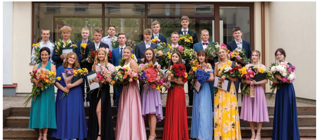
Sillaotsa kooli 9. klassi lõpetajad.