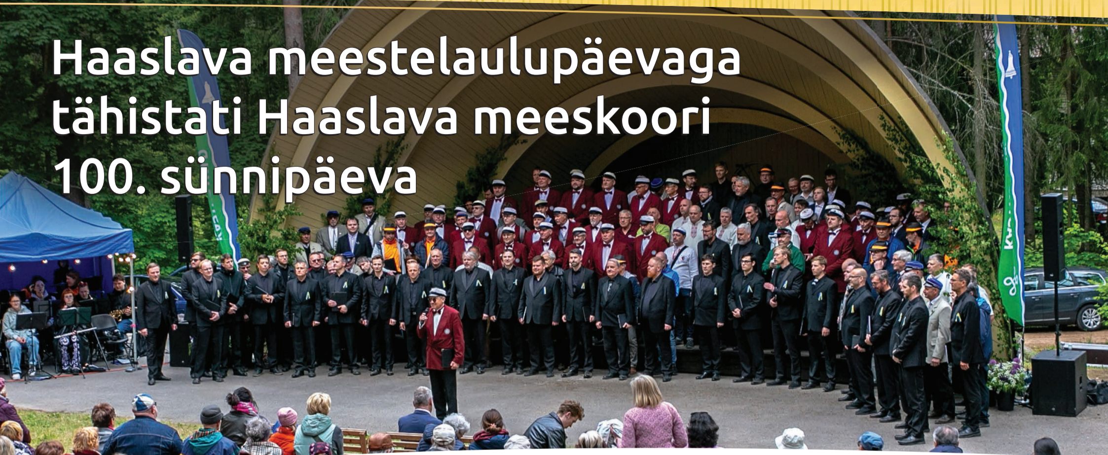
Kurepalu mändide all laulsid juuni alguses koos Haaslava meeskoori ja Eesti rahvusmeeskooriga kokku 150 laulumeest üle Eesti.

AUTOR: BIRGIT PETTAI, KOMMUNIKATSIOONISPETSIALIST