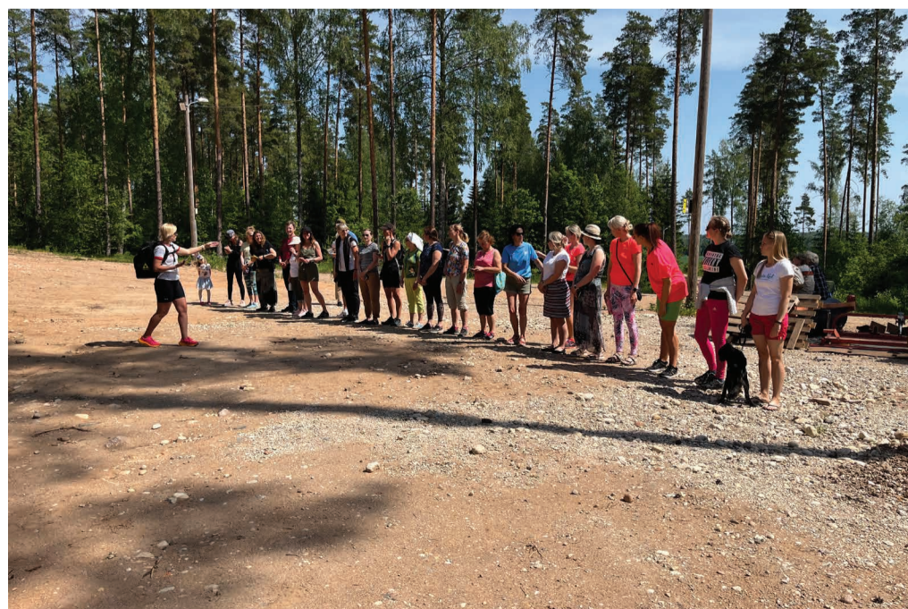
Kastre valla õpetajad vooremäel.

Peamine eesmärk on olnud koolide koostöö edendamine ning omavaheliste suhete tugevdamine. Oleme õppinud paremini tundma oma kolleegi ning seejuures julgustanud jagama parimaid praktikaid. Esimesed kolm üritust on väike samm suurema eesmärgi suunas. Jätkame uuel õppeaastal juba uue hooga.