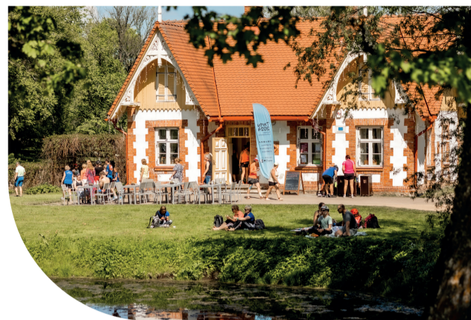
Luke kodukohvikute päev Kärnerimaja

Mõisa vanas viinaköögis sisse seatud jahedas kõrgete lagedega kodukohvikus pakutava heigiprae jaoks kõhus enam paraku ruumi ei jagunud, kuid palaval kevadpäeval oli võilille-mesise suvelõhna nautimiseks ja peatseks kojusõiduks avara ruumi jaheduses paras jaksu koguda. Samal ajal einestajad nägid igatahes rahulolevad välja seega külalaps olid ka selle kohviku kokad tasemel.