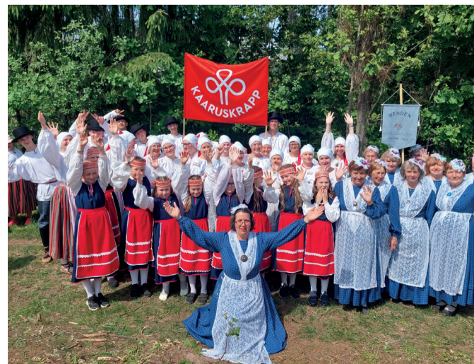
Wenden, Kaaruskraap, Kaera-Marid, Võnnu Keskkooli 3. klass "Võnnu Väänikud" V Kagu-Eesti tantsupeol "Minu Südamel"