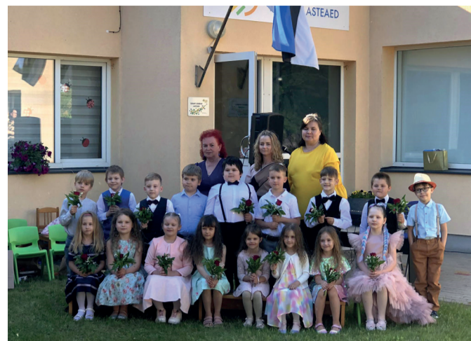
Võnnu Lasteade Värupere lõpetajad 23.05.2024