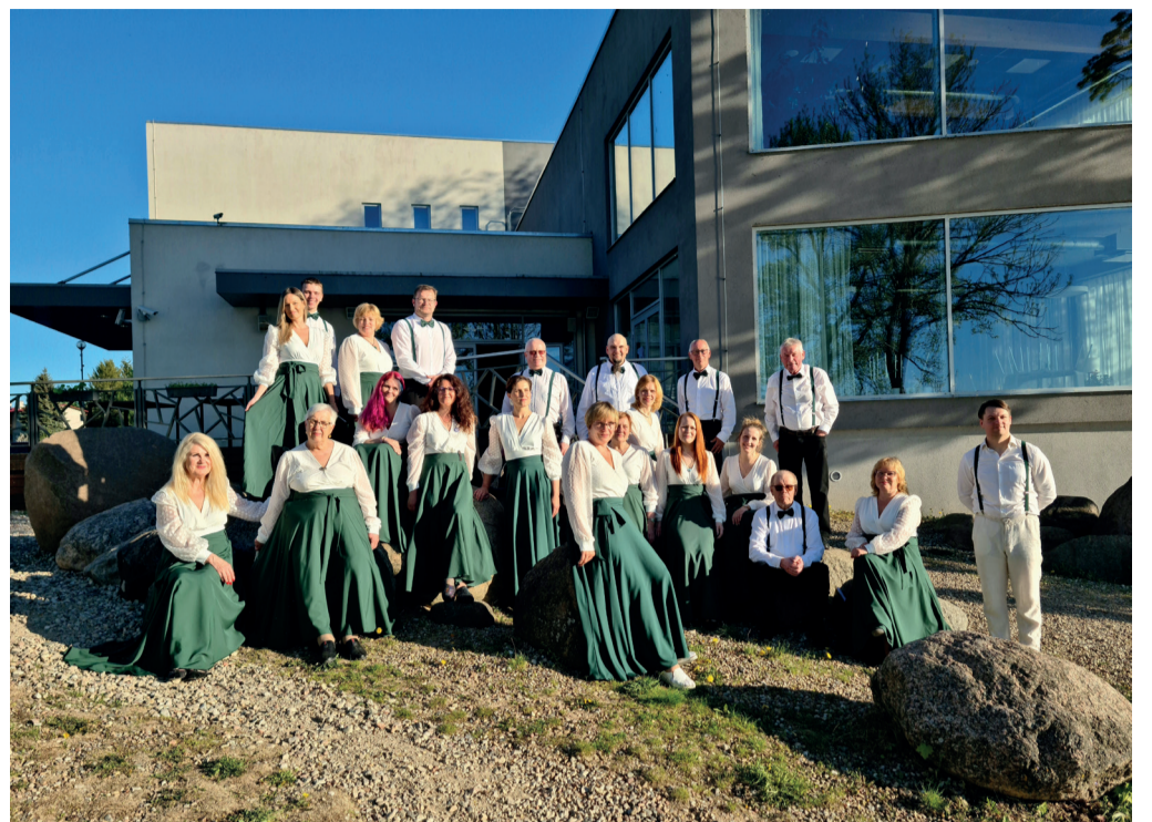
Võnnu Kihelkonnakoor, KIHKO

KIHKO koorivanema rollis olles nägin kogu kontsertide korraldus