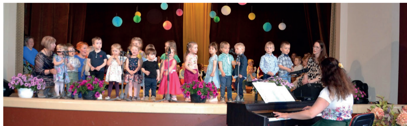
Värupere kevadkontsert 16.05.2024

da ning loosi tahtel korraldab "Kastre valla lasteade II spordipäeva" Sillaotsa Kooli Roiu lasteade! Andsime teatavalt üle ja jääme põnevusega ootama uusi sportlikke väljakutseid. Meie lapsed (loe: Värupere lasteaiatöötajad) on motiveerivaks