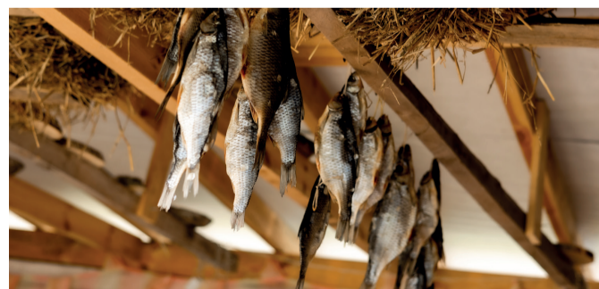
Sibulatee KALApuhvetite päev