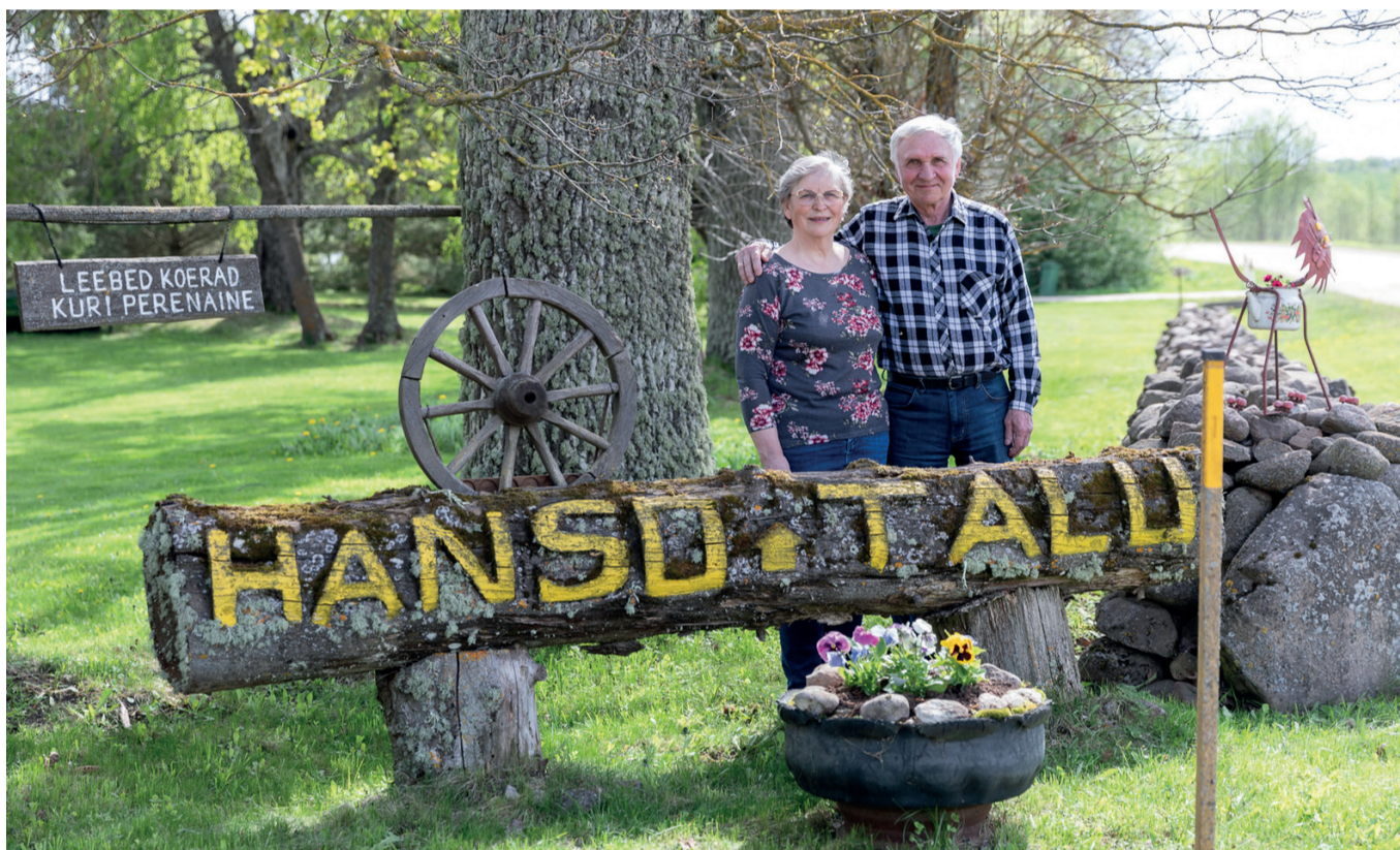
Hanso talu peremees ja perenaine