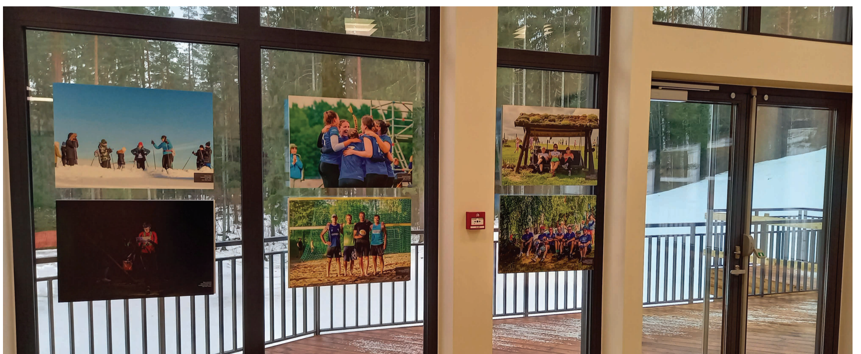
Fotod näituselt.